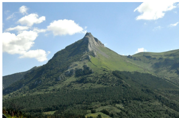
FigureLe Txindoki par beau temps