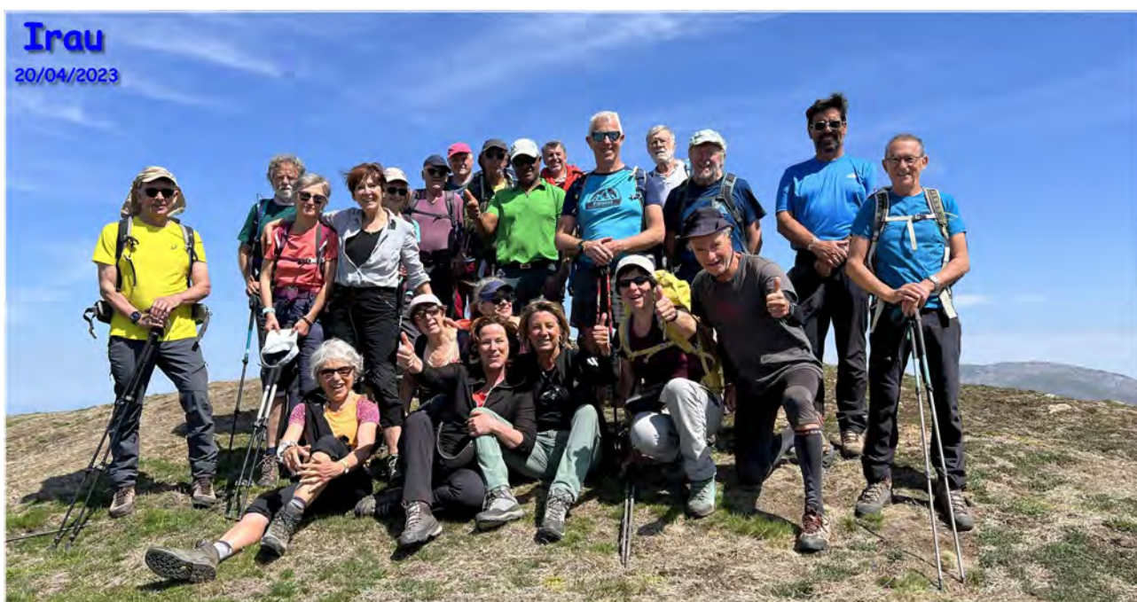
Notre groupe au sommet

En route nous trouvons un agneau blessé qu'un bon samaritain rapporte à la ferme. Les plus téméraires se jettent dans la vasque sous le pont !! Et tous prennent le pot de l'amitié dans ce beau cadre bucolique.