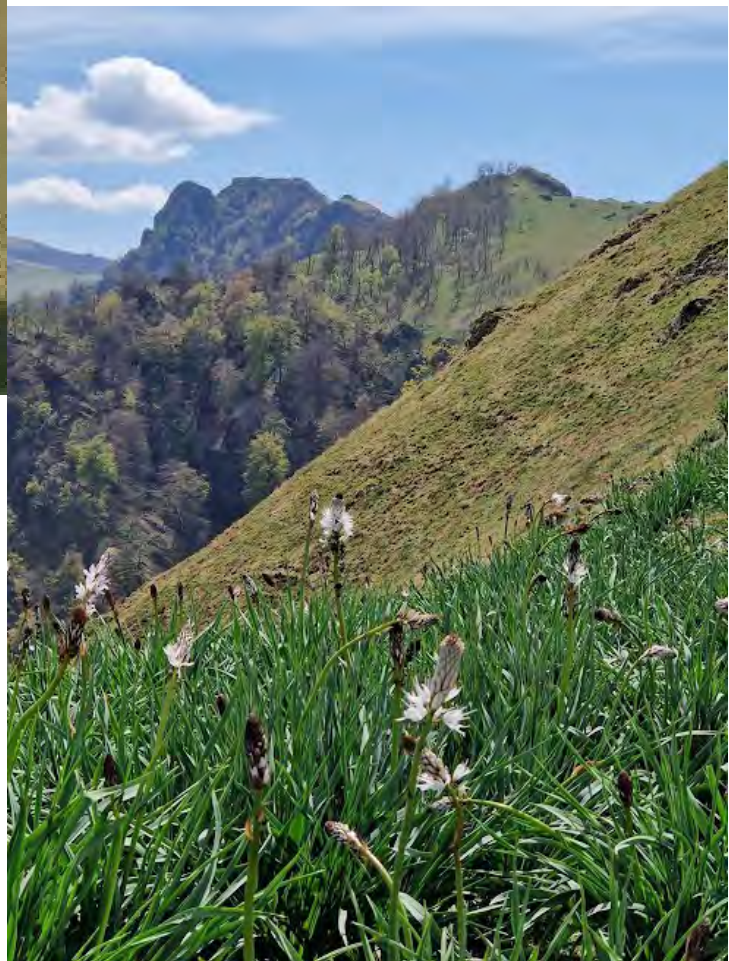
Crête de la descente et l'Irau en fond