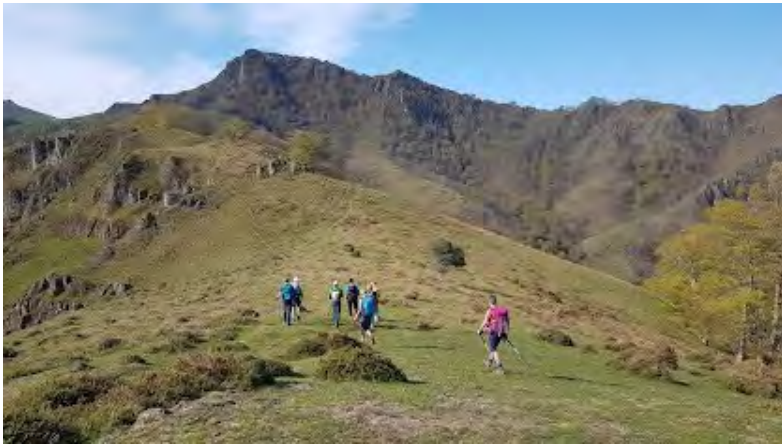
La crête de montée vers l'Irau